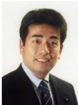
～もっと身近に県政を～