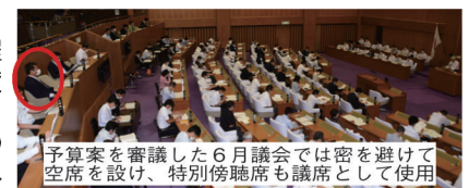
予算案を審議した6月議会では密を避けて空席を設け、特別傍聴席も議席として使用

第349回6月定例県議会に上程された令和2年度6月補正予算は、約1,121億円の規模で、第2波への